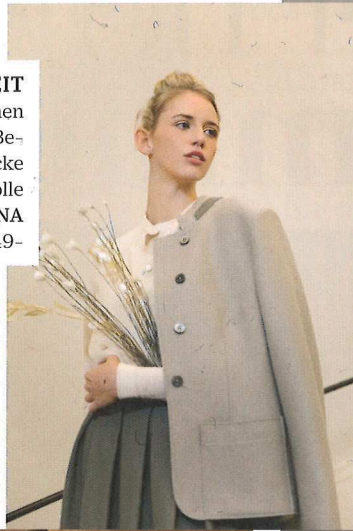
KLARHEIT Für Looks zwischen Strenge und Be- quemlichkeit: Jacke aus gekochter Wolle von JOSEF&ANNA um € 449,-