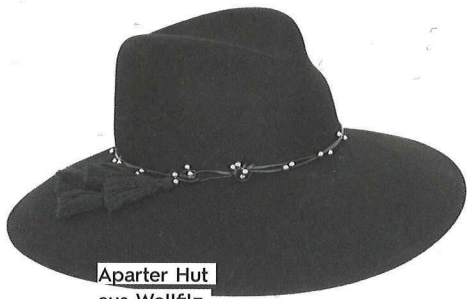
Aparter Hut aus Wollfilz von MAYSER um € 139,-