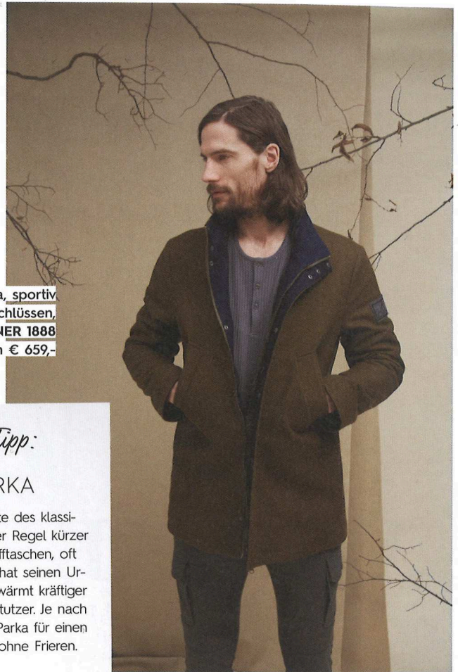
Lodenparka, sportiv mit Reißverschlüssen, von STEINER 1888 um € 659,-