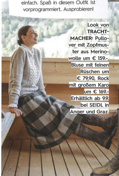
Look von TRACHT-MACHER: Pullover mit Zopfmuster aus Merinowolle um € 159,-, Bluse mit feinen Rüschen um € 79,90, Rock mit großem Karo um € 169,-. Erhältlich ab 99,- bei SEIDL in Anger und Graz.