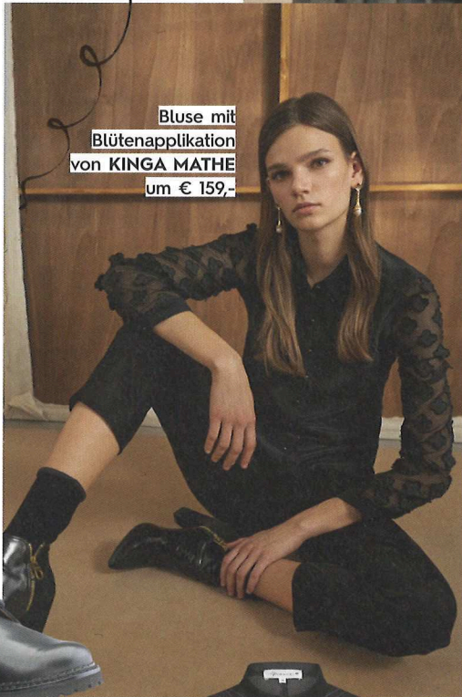
Bluse mit Blütenapplikation von KINGA MATHE um € 159,-

Ganz unaufgeregt einfach ein gemustertes Teil pro Outfit kombinieren: Langarmbluse von WALLMANN um € 179,-.