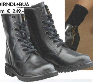
Stiefel von DIRNDL+BUA um € 249,-

WAS WIR LIEBEN: Schwarz, Tüll, Atempausen.