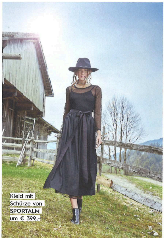
Kleid mit Schürze von SPORTALM um € 399,-