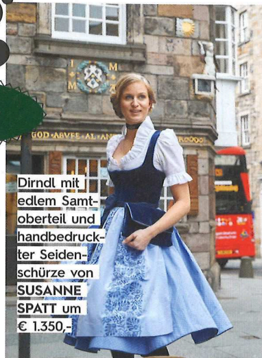
Dirndl mit edlem Samtoberteil und handbedruckter Seidenschürze von SUSANNE SPATT um € 1.350,-