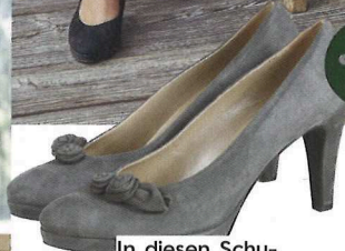
In diesen Schuhen schwebt man fast: Pumps SOMMERALM um € 289,-