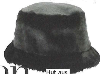
Hut aus Webpelz von MAYSER um € 79,-

Haben Sie die Fröhlichkeit gepachtet? Oder stimmt Sie der Herbst melancholisch? Wir geben allen Emotionen Raum, und den passenden Look als Anregung für stimmungsvolle Stunden.