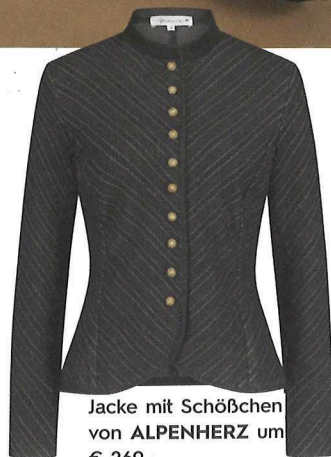
Jacke mit Schößchen von ALPENHERZ um € 269,-

Man darf ja von der Mode hal- ten, was man will, aber eines kann man von ihr lernen: Das Spiel mit Stilbrüchen. So kombinieren Sie doch einmal derbe Boots zu feinstem Gewand: Sie werden Augen machen, wie sehr man Ihnen schöne Augen macht. Wunderbarer Nebeneffekt: Selten so gemütlich ausgegangen!