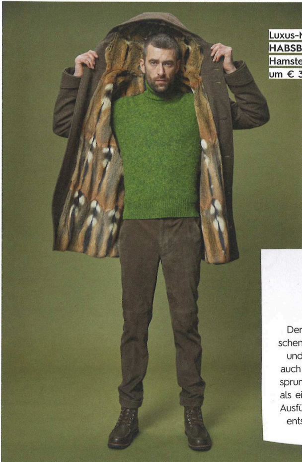
Luxus-Mantel von HABSBURG mit Hamsterfell gefüttert um € 3.499,-