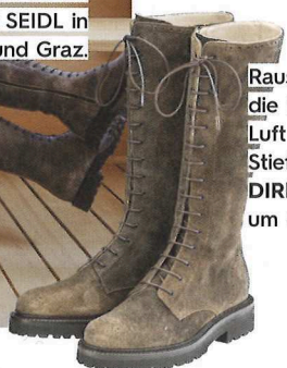
Raus an die frische Luft in den Stiefeln von DIRNDL+BUA um € 379,-